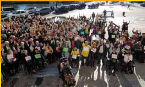
Chaîne humaine à l'initiative de l'APF devant la mairie de Bayonne

Mobilisés contre l'homophobie et la transphobie, Les Bascos le sont aussi contre l'ensemble des discriminations fondées sur le sexe, l'âge, le physique, l'origine, la sérologie, le genre...