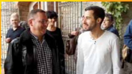
Pot d'accueil avec l'antenne de Pau Arcolan en septembre 2015