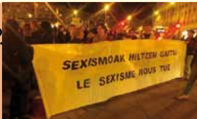
Rassemblement contre les violences sexistes