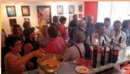
Txalaparta lors de l'inauguration

Au coeur de Bayonne, l'espace Txalaparta , c'est :