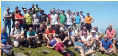
Randonnée avec l'association Gehitu

Partage d'émotions, de sensations, de passions sont aussi au rendez-vous des activités de l'association. Chacun peut trouver sa place, son groupe.