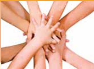
La solidarité au quotidien

Les Bascos ont la volonté de faire vivre la solidarité non seulement dans leur discours, mais aussi dans leurs actes : face au handicap, au vieillissement, à la maladie, à l'exclusion.