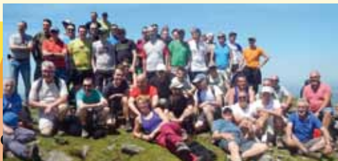
Randonnée avec l'association Gehitu

Partage d'émotions, de sensations, de passions sont aussi au rendez-vous des activités de l'association. Chacun peut trouver sa place, son groupe.