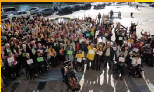
Chaîne humaine à l'initiative de l'APF devant la mairie de Bayonne

Mobilisés contre l'homophobie et la transphobie, Les Bascos le sont aussi contre l'ensemble des discriminations fondées sur le sexe, l'âge, le physique, l'origine, la sérologie, le genre...