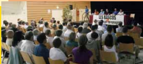
Les Bascos en Assemblée Générale

L'association Les Bascos , créée en 2006, a son espace d'accueil depuis 2014.