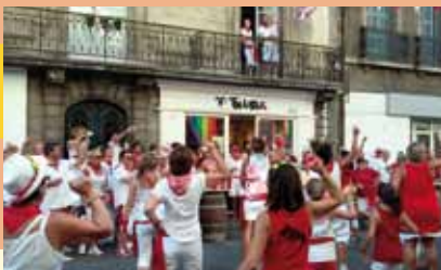
Flashmob devant l'espace Txalaparta

L'ouverture aux autres et aux différences est essentielle au sein des Bascos qui proposent, tout au long de l'année :